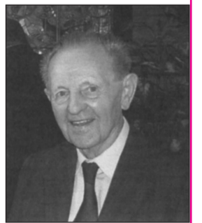
Miloš Jakeš, * 12. 8. 1922

Ústřední výbor Komunistické strany Československa Praha 12. srpna 2016