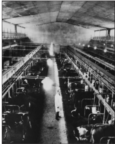
Odchovna pro 800 kusů mladých jalovic v Lesné u Tachova

Naším úkolem nebylo statisticky zdokumentovat ohromný rozvoj československého socialistického státu ve všech